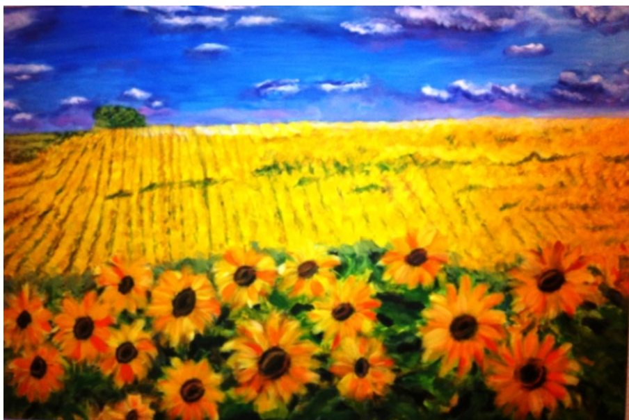
Pintura: Campo de Girasoles